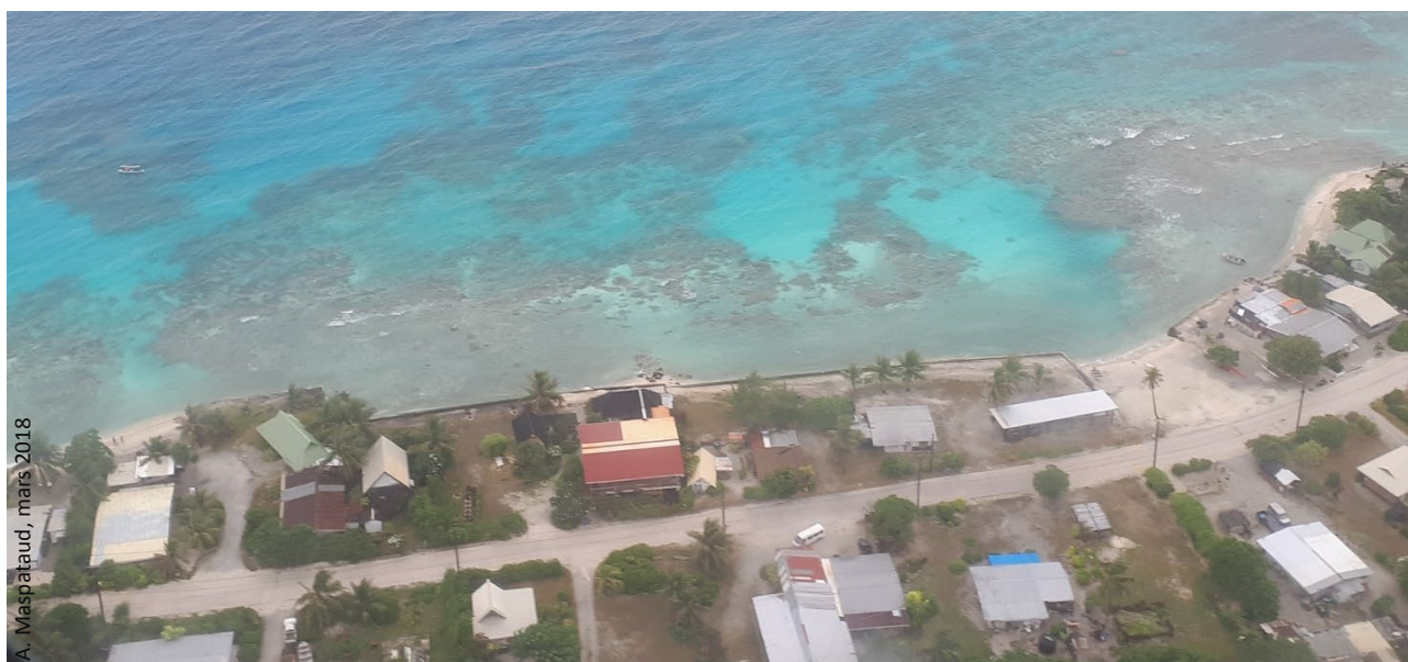
A. Maspataud, mars 2018

Objectif : Ce module permet de rappeler quels sont les grands types d'impacts du changement climatique et en quoi ils exercent une pression sur les systèmes côtiers tropicaux ; et de replacer le rôle du facteur "élévation du niveau de la mer" dans le panel de facteurs en jeu. Il comporte également un volet prospectif. Ainsi, il permet de dresser un bilan de l'état des connaissances et s'appuie sur des exemples variés à l'échelle des îles tropicales pour aborder les SCC développés en Polynésie française dans le cadre d'INSeaPTION.